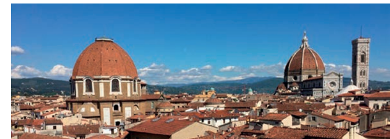
Firenze dalla terrazza dell'Hotel Baglioni, sede del congresso

APOS desidera creare un canale di dialogo con i partecipanti, che non si esaurirà solo nel congresso, ma proseguirà sul web e in una serie di corsi satelliti.